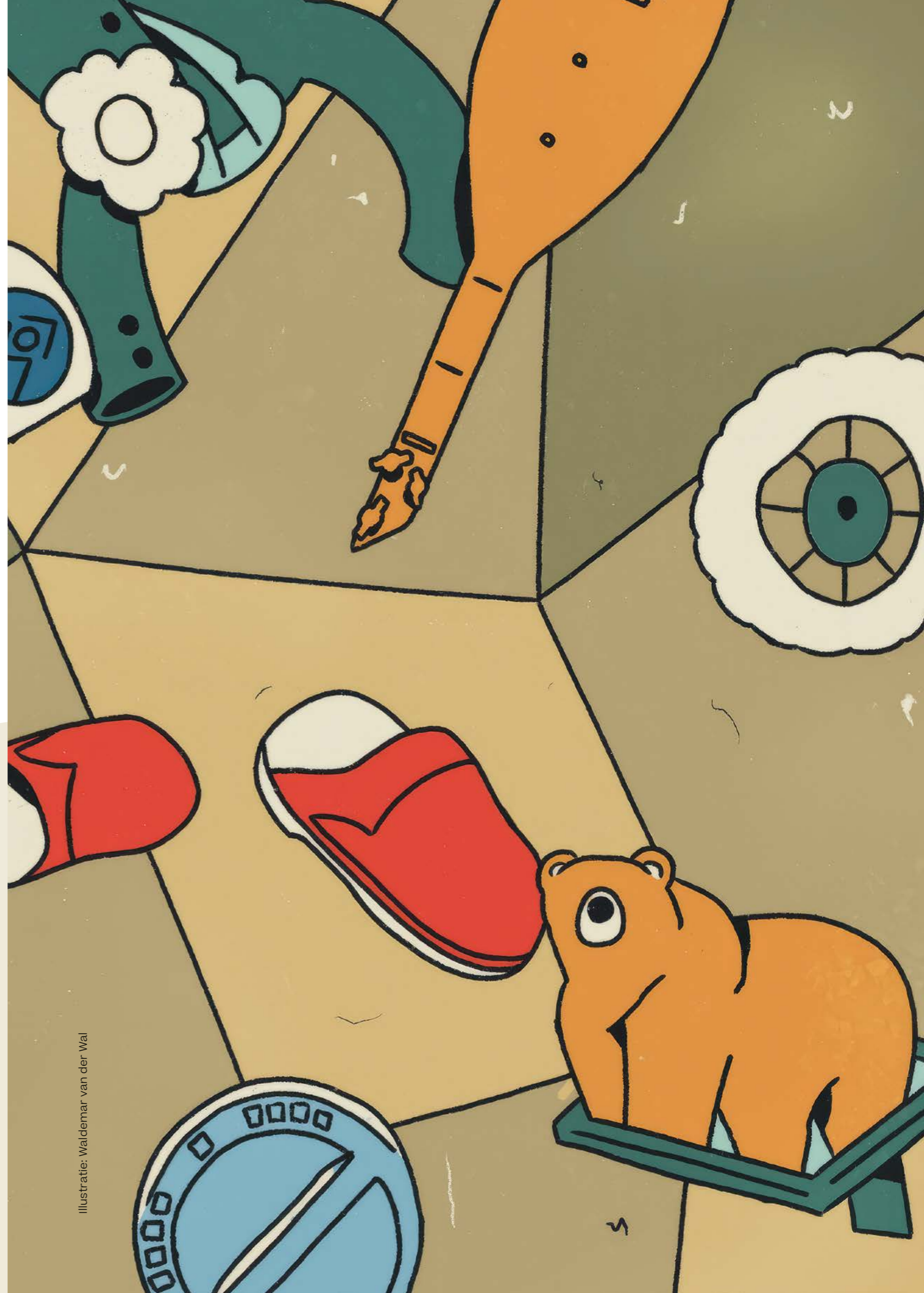
Illustratie: Waldemar van der Wal

Haar verhalende foto's omschrijft ze zelf als 'imaginary documentary'. Haar werk heeft vaak een sociaal-maatschappelijk uitgangspunt, is tot in detail geënceneerd en gestileerd, wordt gekenmerkt door sterk licht-donkercontrast, is geïnspireerd door Edward Hopper en Amerikaanse fotografen uit de jaren zestig en focust op sociaal relevante thema's.