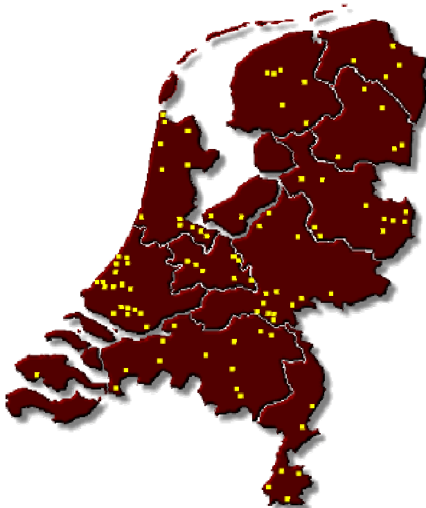
Afbeelding 1: Overzicht bijgewoonde regionale activiteiten

In totaal zijn 106 verschillende regio's en gemeenten genoemd waar men ter gelegenheid van de Nederlandse Veteranendag is geweest. Deze zijn bijna allemaal op het kaartje terug te vinden. Er zijn plaatsen die opvallend vaak genoemd worden. Zo blijken 20 respondenten tijdens de Nederlandse