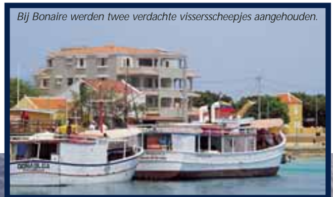
Bij Bonaire werden twee verdachte vissersschepjes aangehouden.

Toch ligt de sleutel tot succes volgens de commandant niet in het opereren als ‘Fast Combat Support Ship’, noch in de multifunctionaliteit van de bevoorraders. “It’s the crew that makes the difference! Ik zeg dan ook met overtuiging dat mijn team zijn mannetje staat en dat wij gezamenlijk terugkijken op een goed en bovenal succesvolle Westterm.”