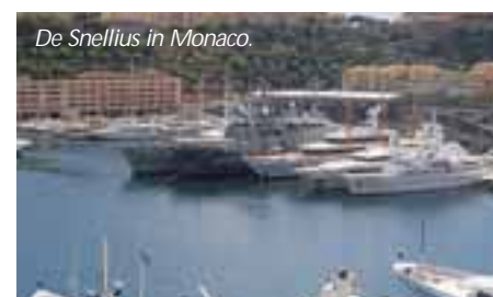
De Snellius in Monaco.

Hydrographic Organization werd gehouden. De vertegenwoordiging van de Dienst der Hydrografie maakte van deze gelegenheid gebruik om aan boord te overnachten.