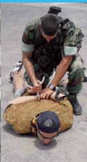
Een ontsnapte gevangene wordt ingerekend.