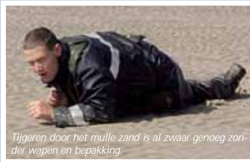
Tijgeren door het mulle zand is al zwaar genoeg zonder wapen en bepakking.

geïnteresseerd zijn in een geüniformeerd beroep, maar geen idee hebben van alle mogelijkheden en nog te jong zijn om te solliciteren. Tijdens de V&V bezoeken de leerlingen de Oriëntatiedagen die gelijktijdig bij de KL en KM gegeven worden. Tijdens deze dagen krijgt de leerling alvast 'beeld en geluid' van een krijgsmachtonderdeel. Een onderdeel van de opleiding V&V is de Beroepspraktijkvorming (BPV). Dit is een periode van zes weken die doorlopen wordt bij de Koninklijke Marine of Koninklijke Landmacht. De leerling maakt hierbij zelf de keuze bij welk krijgsmachtonderdeel de BPV wordt gevolgd. "De afgelopen drie jaar hebben er gemiddeld 350 V&V leerlingen per jaar de beroepspraktijkvorming bij de SMVBO doorlopen. Van dit aantal dient