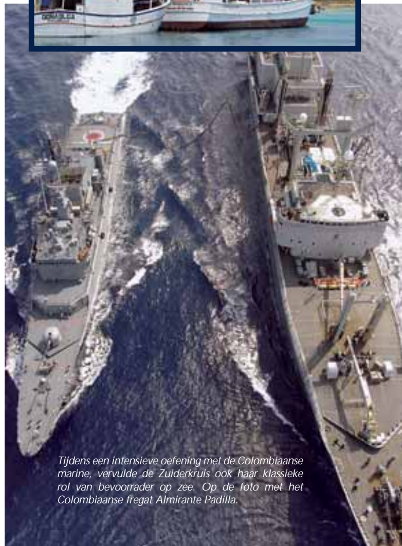
Tijdens een intensieve oefening met de Colombiaanse marine, vervulde de Zuiderkruis ook haar klassieke rol van bevoorraders op zee. Op de foto met het Colombiaanse fregat Almirante Padilla.