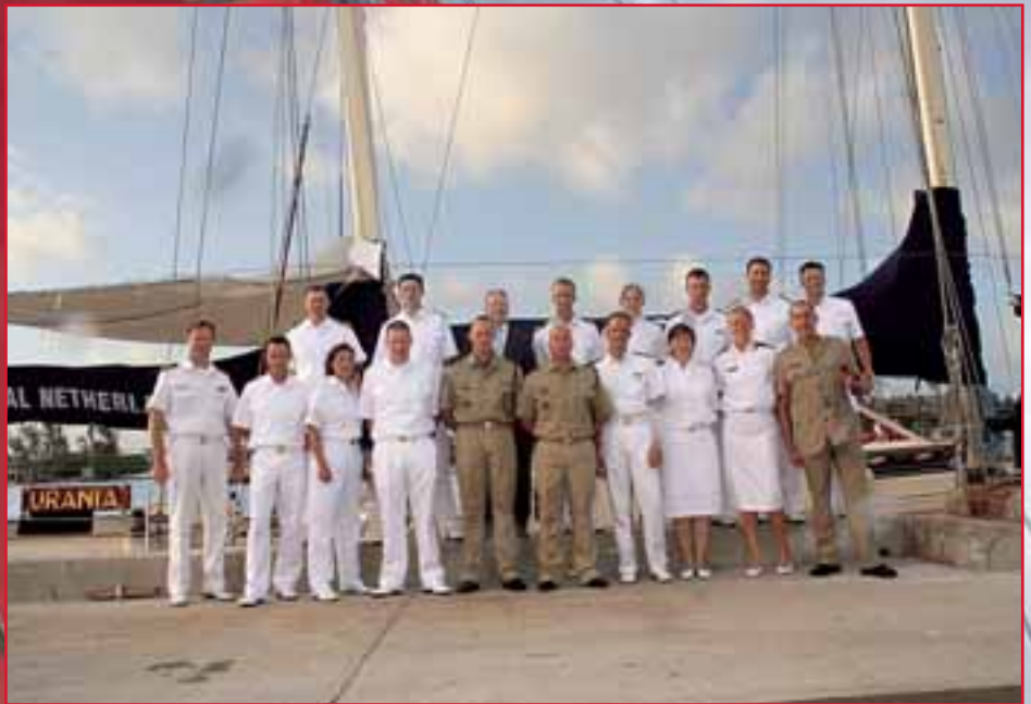
De hele bemanning gefotografeerd op de Bahama's.