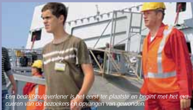
Een bedrijfshulpverlener is het eerst ter plaatste en begint met het evacueren van de bezoekers en opvangen van gewonden.