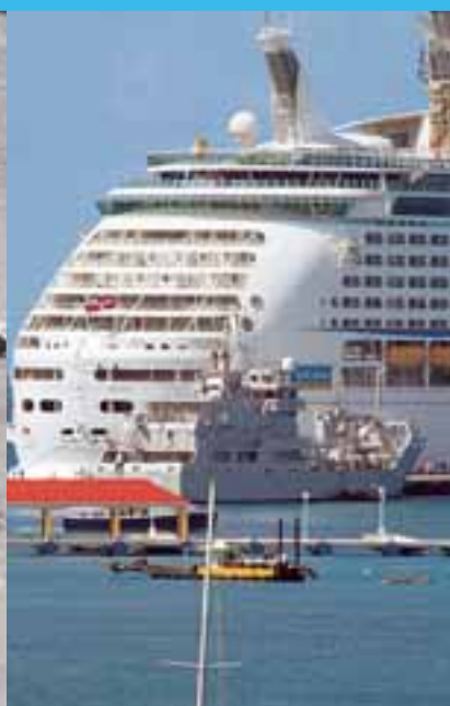
Hr.Ms. Pelikaan arriveerde 48 uur na de passage met hulpmiddelen en voertuigen.