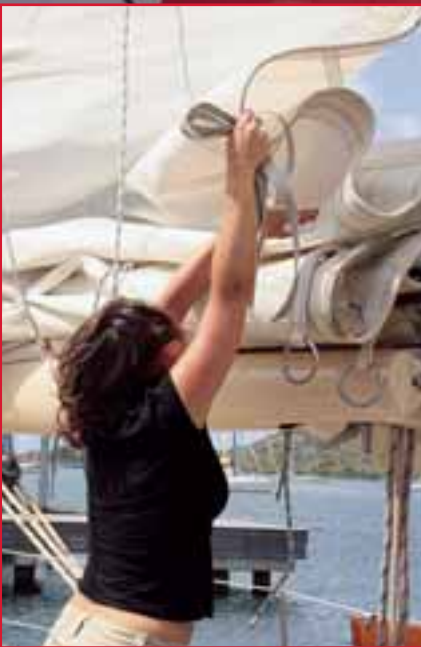
Het is tijdens de reis al een paar keer eerder gebeurd dat zeilen of delen van het beslag het begaven.