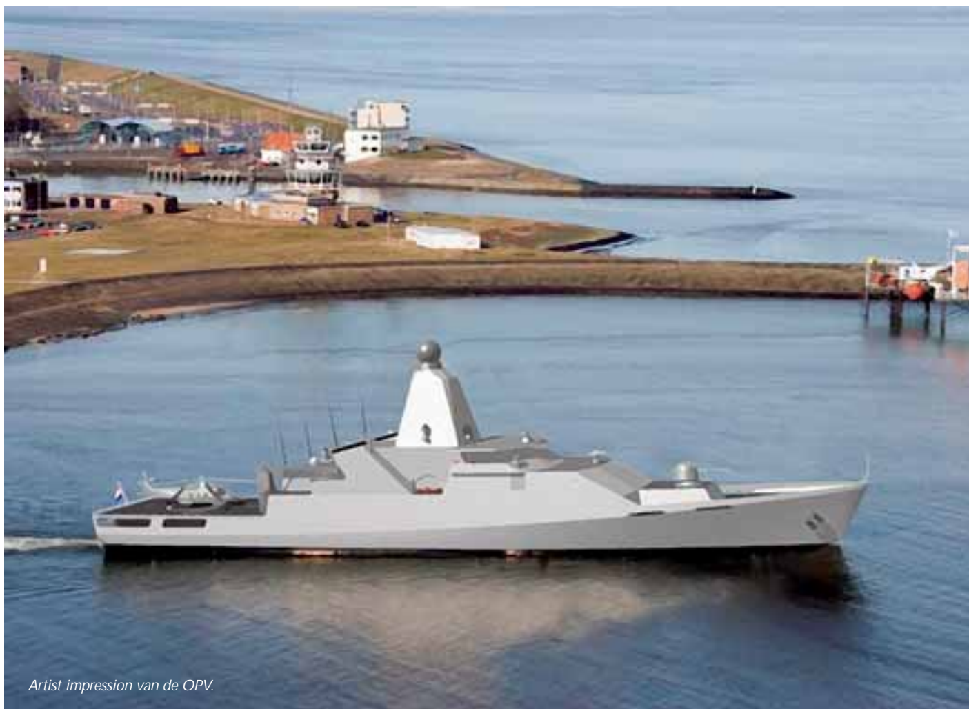
Artist impression van de OPV.