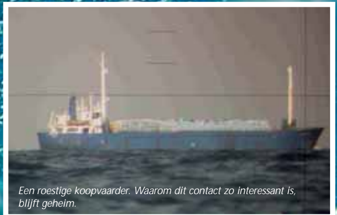
Een roestige koopvaarder. Waarom dit contact zo interessant is, blijft geheim.

Een roestige koopvaarder wordt aan alle kanten door de periscoop bekeken