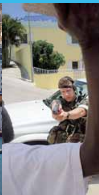
Tijdens één scenario wordt een schietincident gesimuleerd.