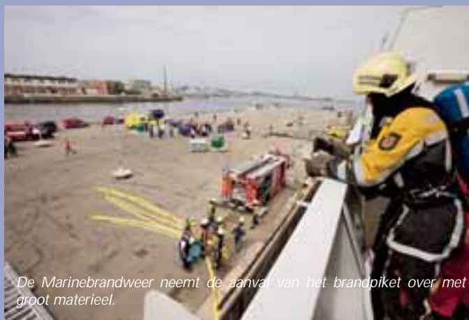
De Marinebrandweer neemt de aanval van het brandpiket over met groot materieel.