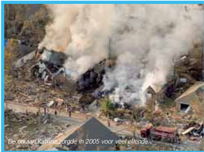
De orkaan Katrina zorgde in 2005 voor veel ellende.

“Charge”, weergalmt het door de straten van Mullet Bay. Met geheven wapenstok rennen twee geweergroepen in formatie voorwaarts. De oproerkraaiers stuiven uiteen, terwijl de mariniers met gesloten gelederen weer hun uitgangspositie innemen. Na enkele perfect uitgevoerde charges, kiezen de opstandelingen toch eieren voor hun geld. “Indrukwekkend”, vindt Oosterlee die niets kan aanmerken op