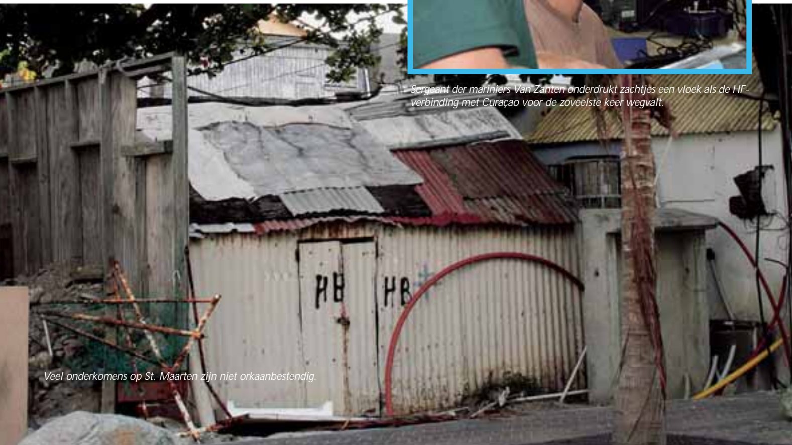
Veel onderkomens op St. Maarten zijn niet orkaanbestendig.