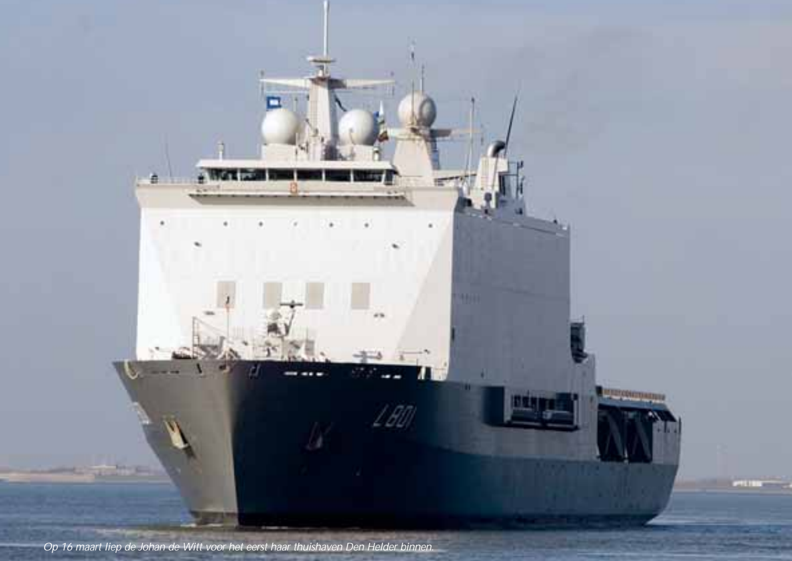
Op 16 maart liep de Johan de Witt voor het eerst haar thuishaven Den Helder binnen.

moment in Amsterdam, toen na die testvaart de Johan de Witt voor het Engelse vliegdekschip Ark Royal in de haven in het IJ aanmerde.