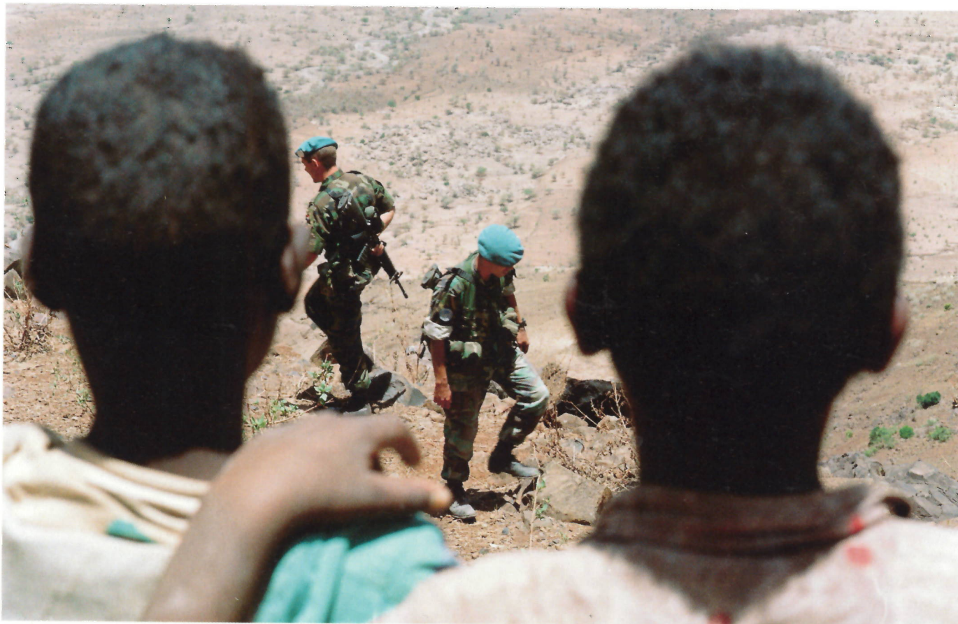
■ Nederlandse mariniers passeren tijdens een patrouille twee Eritrese jongens, Eritrea, 18 mei 2001.

dorpen, die van de bewoonde wereld waren afgesloten, kunnen bevoorraden. Dat was een goede zaak, maar we hadden meer kunnen doen, denk ik..." Na trainingen in Schotland en Engeland nam Schenk deel aan een speciale training in Amerika en werd daarna op Aruba geplaatst. "Ik was net terug in Nederland toen UNMEE ging spelen en werd ingedeeld bij de Bravo-compagnie die in Ethiopië werd gelegerd."