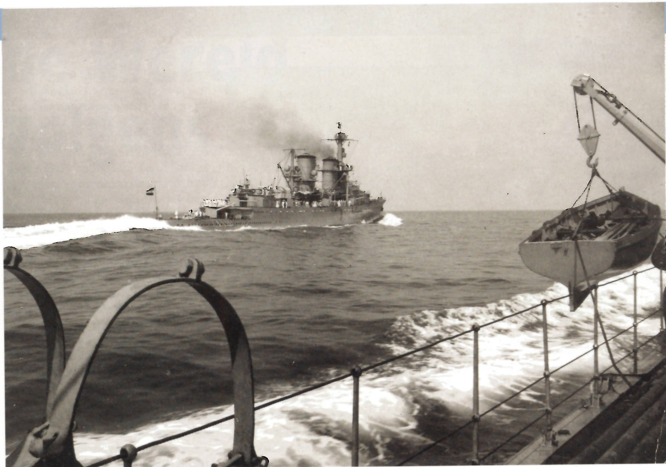
■ De lichte kruiser Java, gezien van de kruiser De Ruyter.